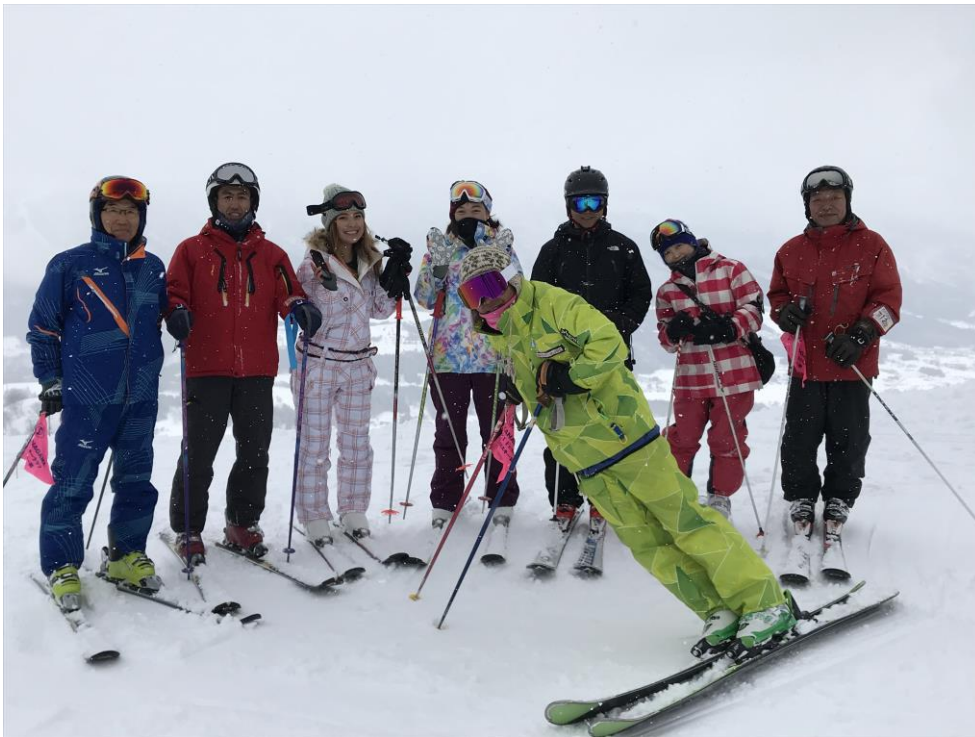
戸狩温泉スキー場 ペガサスゲレンデ頂上